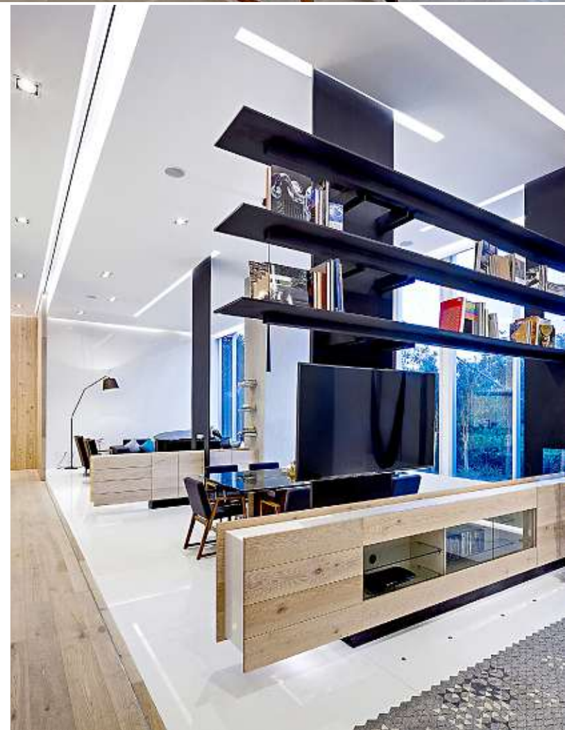
La sala de TV está separada parcialmente del resto de las áreas sociales.