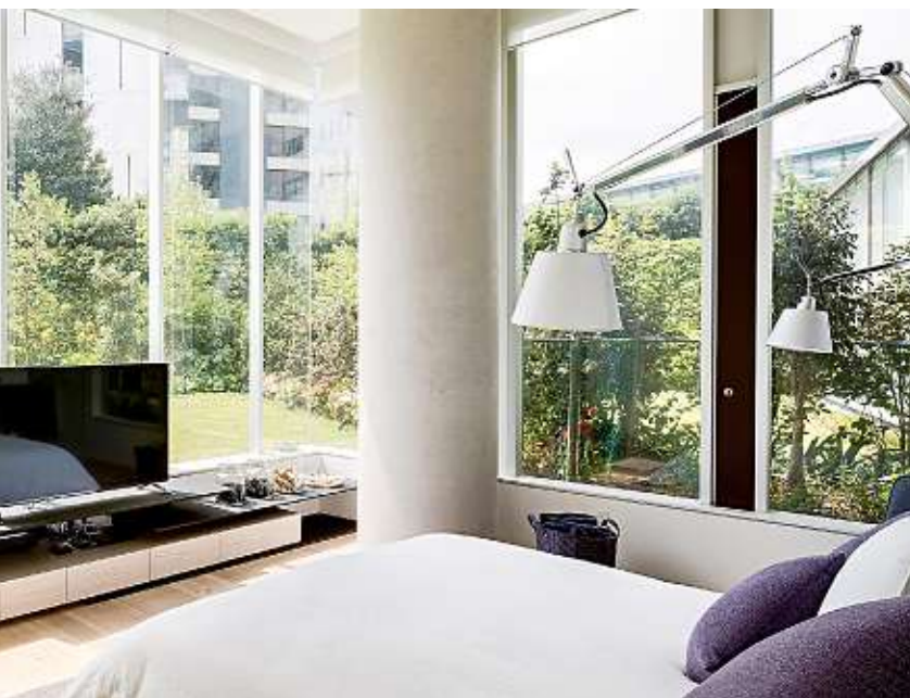
■ Los ventanales generan amplitud y enlazan los interiores con su contexto.