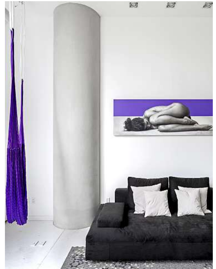
■ Elementos artísticos fueron usados como contraste de color y acentos visuales.

Otro de los ambientes protagonistas es la cocina, espacio que se ha diseñado de forma abierta con la finalidad de impulsar la convivencia a su alrededor.