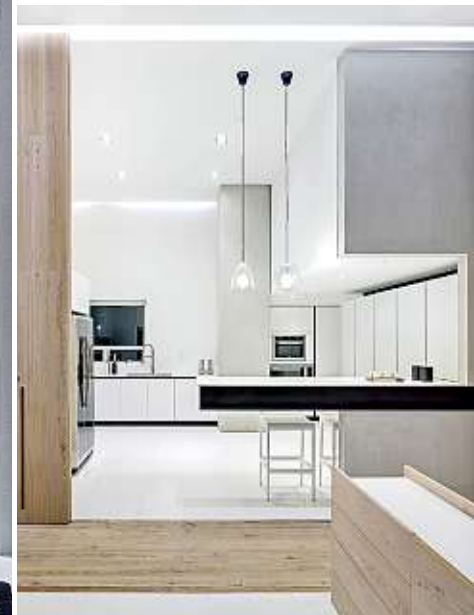
■ Lámparas colgantes equilibran la dimensión del lugar.