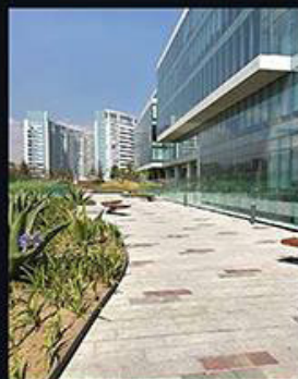
QUAD CAMIRUS CORPORATIVO SANTA FE (Torres 1 y 2) / Arquitectura y Construcción + EZ Desarrollo Inmobiliario / Ciudad de México Este imponente desarrollo se compone de cinco edificios de oficinas, cuatro de ellos ordenados alrededor de una plaza central con un espejo de agua. Cuenta con más de 15 mil metros cuadrados de áreas verdes.