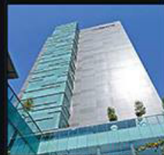
CORPORATIVO VISTA ALBUQUERQUE / Elías Estudio / Guadalajara, Jalisco Con una vista privilegiada de la zona de Puerta de Hierro y el bosque de los Colomos, este corporativo viene como inspiración el ser no sólo un complejo, sino un punto destino de la zona. Su estructura se caracteriza por una caja de vidrio y el uso de aluminio.