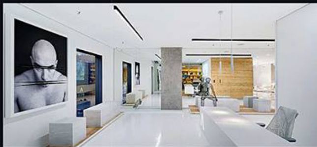
UI2S / Archetonic / Ciudad de México El potencial de una casa de los 50 fue retomado en esta intervención para transformar los espacios de una manera armónica y contemporánea. La obra se caracteriza por su respeto a la composición original de la fachada, destacada por una malla.