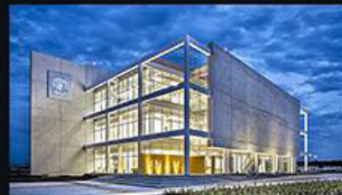
POLO UNIVERSITARIO DE TECNOLOGIA DE LA UNAM / Araulpián / Monterrey, Nuevo León. El primer campus de la UNAM, al norte del País, dice a través de su estructura: "Aquí se hace ingeniería". Su diseño, concebido como un gran mecano, captura la esencia abstracta de los edificios de CU, mientras que las plazas fueron resueltas con piedra volcánica llevada del Pedregal.