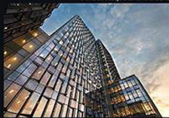
BBVA BANCOMER CENTRO OPERATIVO / IDEA Asociados + SOM / Ciudad de México Esta torre de 30 niveles, más nueva de estacionamiento en sótano, tiene certificación LEED Gold y para su desarrollo se consideró no sólo la calidad, sino un balance con sistemas mecánicos sustentables, materiales y acabados que resultaron en un ambiente de trabajo altamente eficiente.