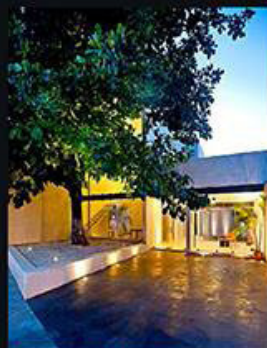
DESPACHO A LA SOMBRA DE UN ALMENDRO / Arturo Carreros Arquitectos / Mérida, Yucatán Trascendente sin ser monumental, este pequeño edificio surgió de la remodelación y ampliación de una casa se caracteriza por la calidez y el confort que brinda. Todo el proyecto gira alrededor de un viejo almendro y plantea el valor de los espacios sencillos.