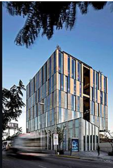
ALLIUS / Tachev Arquitectos / Guadalajara, Jalisco Una imagen potente es el sello distintivo de este edificio, el cual se posa sobre una columna hueca central, mientras que en el perímetro se colocaron puntales de concreto que forman la fachada. Destaca su alta eficiencia un juego de ventanas fijas y de proyección que generan un patrón geométrico.