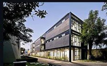
EDIFICIO 1 / 3Arquitectura y Asociados / Zapopan, Jalisco Ubicado al oriente de la Universidad Panamericana, este edificio consiste en tres bloques de tres niveles separados por dos patios. Su estructura está realizada en columnas metálicas y muros de concreto con entrepisos de losacero. Su diseño, libre de revestimiento, destaca los materiales.